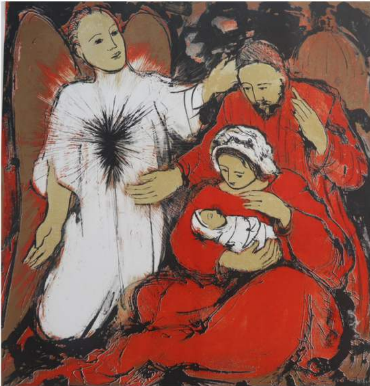
« La Nativité » d'André Bergeron

Cette année encore, le musée a acquis quelques pièces d'importance venant enrichir sa collection. Les acquisitions les plus notables de cette dernière année sont un plâtre original d'Alfred Laliberté, « L'Âme » ainsi qu'un coffret de 9 estampes, « La Nativité » de l'artiste André Bergeron. À cela, on peut aussi souligner l'acquisition d'une porte du couvent des Sœurs du Précieux-Sang qui sera mise à contribution dans l'exposition sur le 350e de Nicolet.