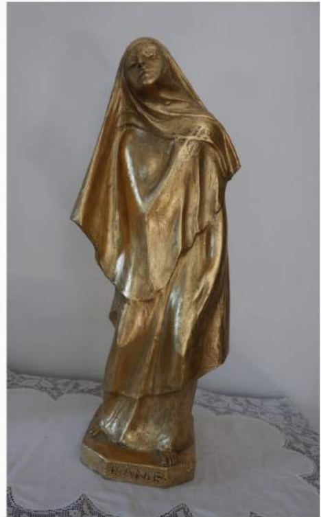
« L'âme » d'Alfred Laliberté